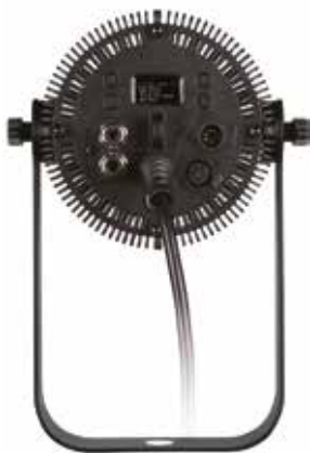
Угол луча 25°